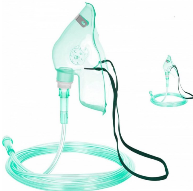
Oxygenátor veľký (10L) - 50 € / mesiac + maska