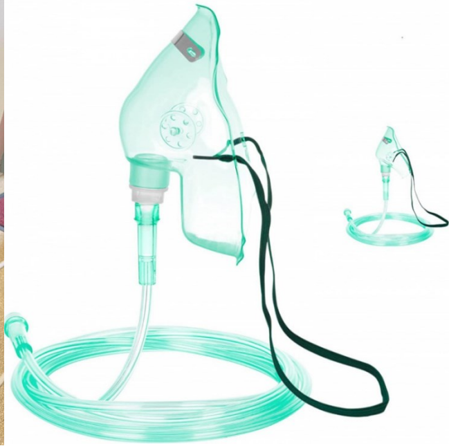
Oxygenátor malý (5L) - 40 € /mesiac + maska