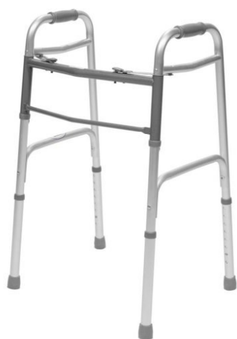
Chodítko pevné – jednoduché - 7 € / mesiac