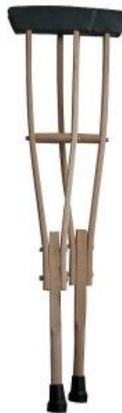
Barle nemecké – 4 € / mesiac