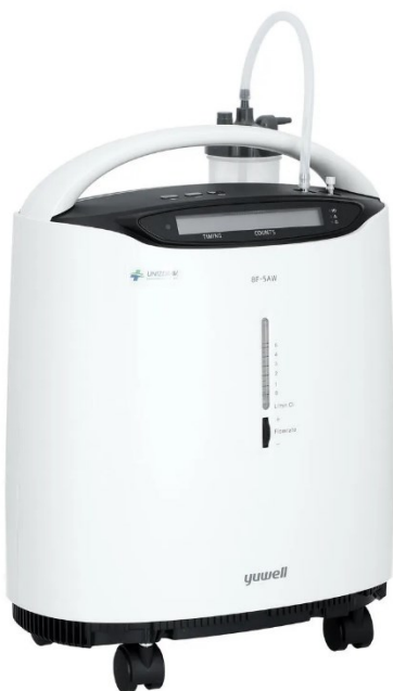
Kyslíkový koncentrátor – 40 € / mesiac + maska