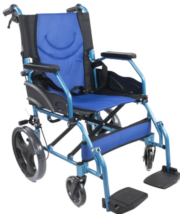
Invalidný vozík - 15 € / mesiac